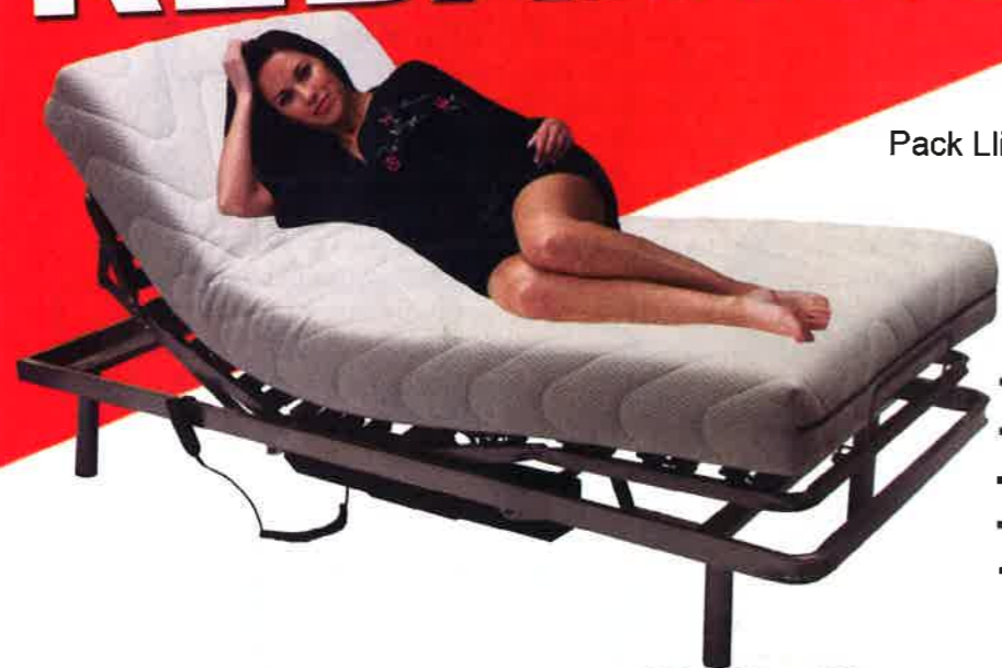
Pack Llit articulat Mod Viscoflex 90x190 cm.